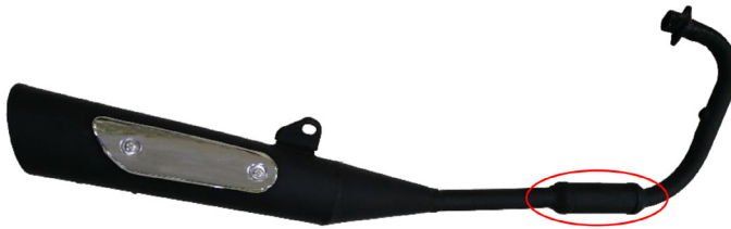
محل نصب کاتالیست داخل منبع اگزوز

هشدار: هیچ وقت تست جرقه را در زمانی که دمای انجین بالاست انجام ندهید. این کار باعث آسیب دیدن کاتالیست می شود.